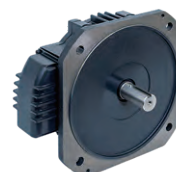
エコPMモータ フラットタイプ

モータ長を大幅に短縮したエコPMモータフラットタイプや、3軸アンプの適用により小型化・省配線を実現したΣ-Xが、装置の小型化に貢献します。