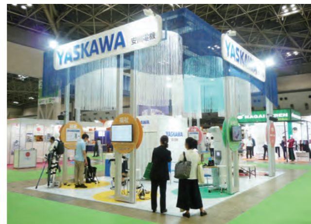
前回の国際福祉機器展の様子

当社はこれまで培ったロボット技術を生かし、先進的な医療・福祉機器市場の創出を目指しています。これらの機器・コンポーネントをCoCoroe(ココロエ)ブランドと名づけ、展開してまいります。