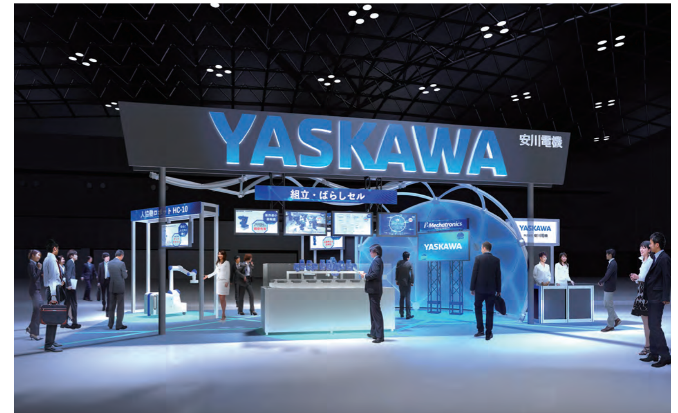
ワールドロボットエキスポ(WRE) 安川電機ブース

WRSでは、展示会のほか同期間中に、技術開発の加速を目的としたロボット競技大会「ワールドロボットチャレンジ(WRC)」も行われます。国内外の大学や研究所、Slerチームなどの競技参加者計16チームがベルトドライブユニットの組立作業のタスクを競います。当社からは国内外のチームに小型ロボット(MOTOMAN-GP7)とアプリケーションを貸与します。