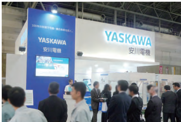
前回の中部パックの様子

食品・包装業界にマッチする新製品、事例を多数用意しておりますので、ぜひポートメッセなごやへお越しください。