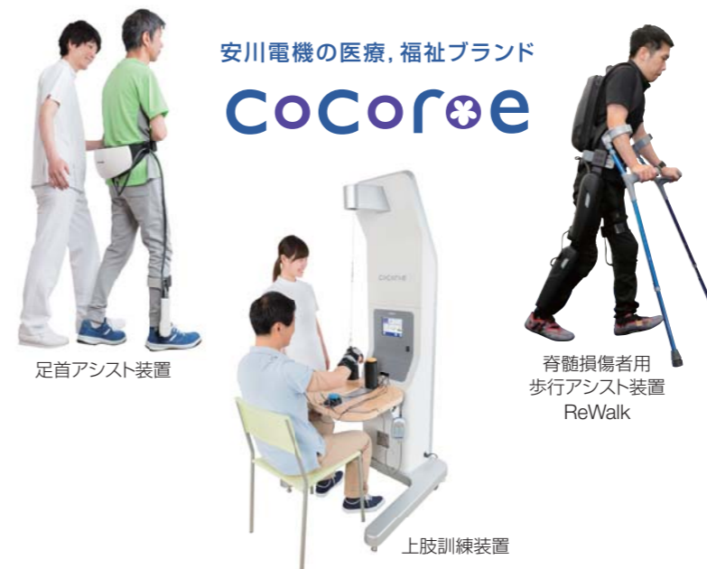
足首アシスト装置

本展示会では、新製品や研究・開発成果を動態展示によりご紹介いたします。ぜひ当社ブースへご来場ください。