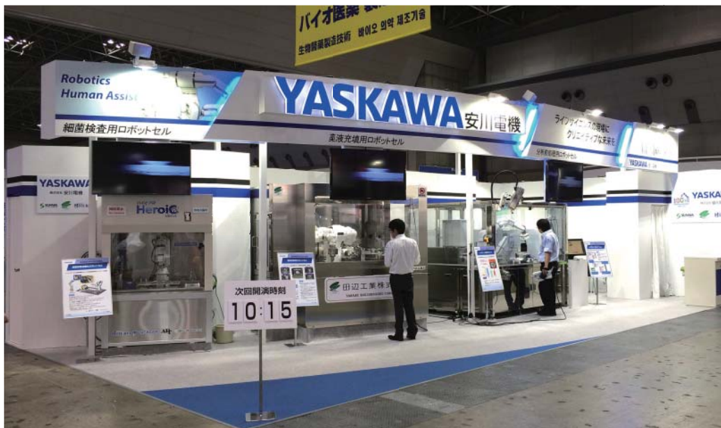
昨年のインターフェックスジャパンの様子

会 期 2016年6月29日(水)～7月1日(金) 10:00～18:00(最終日は17:00まで) 会 場 東京ビッグサイト 東1～6ホール 安川電機ブース小間番号：8-36(東2ホール) 主 催 者 リード エグジビション ジャパン株式会社 U R L http://www.interphex.jp