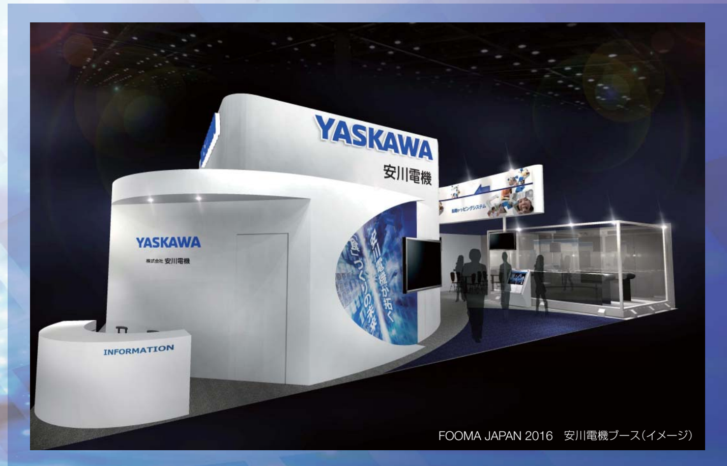
FOOMA JAPAN 2016 安川電機ブース(イメージ)

毎回10万人規模の来場者が訪れ、 食品製造プロセス全体を網羅した世界屈指の総合展として開催される 「FOOMA JAPAN 2016」に出展いたします。 当社ブースでは、『安川電機が拓く「食」づくりの未来』というテーマを掲げ、 当社がこれまで培ってきたロボット技術やサーボ・インバータなどの モーションコントロール技術を活用し、 食品製造の自動化へ向けたトータルソリューションを各種実演を交えて展示いたします。 是非、この機会に安川電機ブースへお越しいただき、 当社ソリューションの数々をご覧ください。