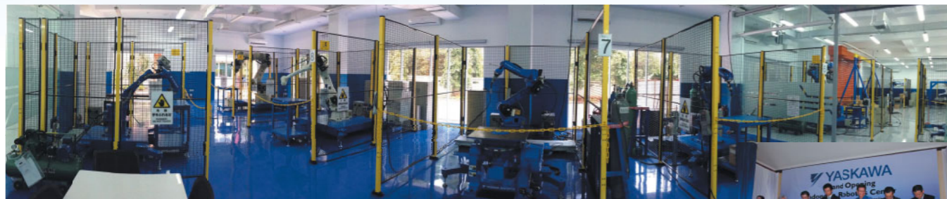
2014年11月21日 インドネシア・ロボットセンタ開所式の様子