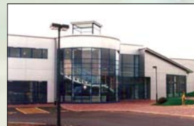
YASKAWA UK Ltd.