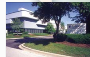
YASKAWA AMERICA INC.