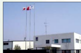
SHANGHAI YASKAWA DRIVE Co., Ltd.