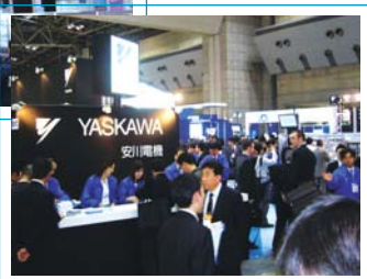
▶ 盛況な当社ブース

FPD供給の大半をまかなうアジア地区のメーカーや関連企業の方々に、年々規模を拡大しています。