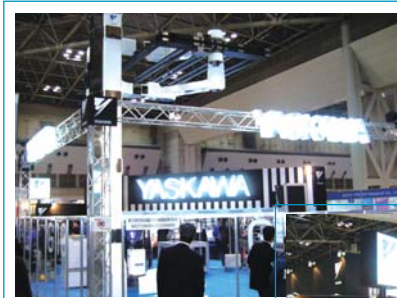
▲ 超大形液晶ガラス搬送ロボットによる搬送デモ

拡大するFPD*市場へより効果的に安川製品をPRすべく、当社は2007年4月11日～13日の3日間、東京ビックサイトで開催されたファインテックジャパンへ初出展しました。本展示会は、液晶テレビに代表されるFPD関連の国内最大の展示会です。出展者や来場者は、日本を始め韓国、台湾、中国など、世界の