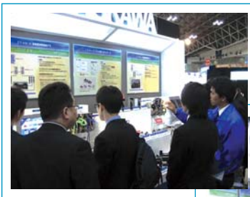
◀ 注目を集めたACサーボドライブΣ-Vの展示

モータ技術展などの10の産業界向けの総合展示会テクノフロンティアが2007年4月18日～20日、幕張メッセにて開催され、当社は「メカトロソリューションの限らない進化!」をテーマに出展しました。