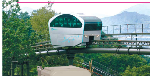
英彦山を走る登山電車