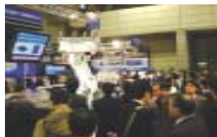
2002年の当社ブース(セミコン・ジャパン2002)

2003年7月に販売開始した最新形のロボットをはじめ、最新のドライブ製品からシステム技術まで安川電機グループの半導体産業への幅広い取り組みをご紹介します。