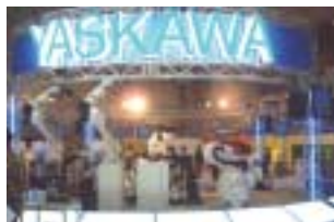
2001年の当社ブース(国際ロボット展)

2003年7月に販売開始した最新形のロボットを中心に、アーク・スポット溶接、塗装、液晶・半導体搬送など、各種アプリケーションに最適なシステムを実演展示し、多様化する用途に適切かつ柔軟に対応できるロボットシステムを提案します。