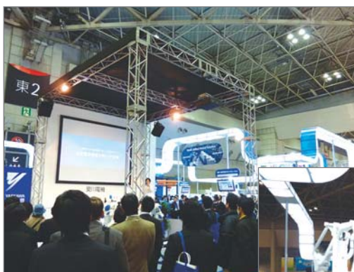
当社出展ブース(メインステージ)