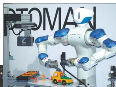
MOTOMAN-SDAによる組立てデモ