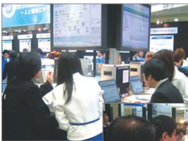
コントローラ体験コーナー

(e-メカサイト: http://www.e-mechatronics.com/ )