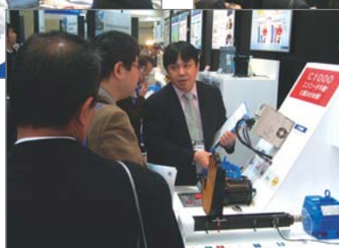
C1000によるエンコーダレス位置決めデモ

■お問い合わせ先: モーションコントロール事業部 営業推進課 TEL: (04)2962-5470 FAX: (04)2962-5913