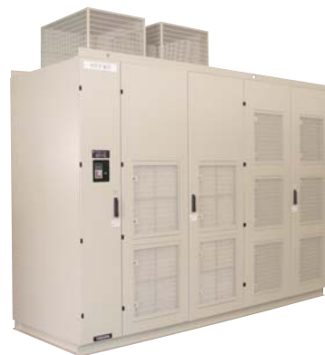
高圧マトリクスコンバータ FSDrive-MX1

今回受賞した当社開発の高圧マトリクスコンバータFSDrive-MX1は、世界で初めて直列多重マトリクスコンバータ方式を採用した製品であり、交流電源から任意の電圧・周波数に直接変換することで、あらゆる用途に適用できる高圧可変速ドライブ装置です。