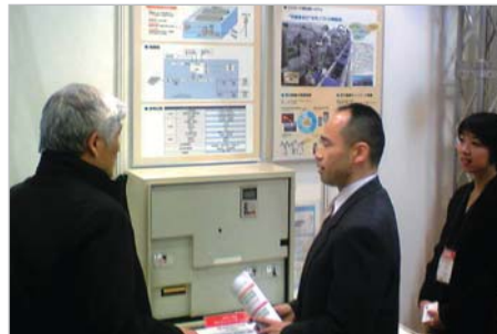
当社ブース: 熱心にPVインバータを説明する開発者