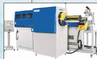
システムエンジニアリング事例 3Dワイヤーフォーミングマシン