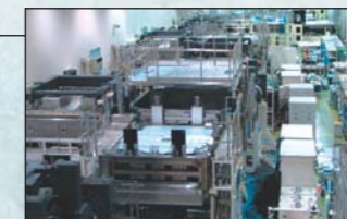
液晶製造装置(OEMによる受託製造) 大形クリーンルーム(クリーン度1万)を備えており、大物装置も充分製作できる環境です。

1977年に自動車の溶接ラインから始まったFA事業は、永年培った自動化技術と精密機械から大形クリーン装置まで対応できる工場設備を武器に、自動車・電子機器・半導体・液晶分野を始めとした、あらゆる工場の生産ラインの立案・設計・製造・立ち上げまでを一貫して行っています。