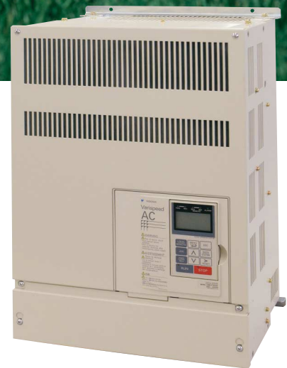
環境対応形モータドライブ マトリクスコンバータ

東京支社 東京都港区海岸1-16-1 ニューピア竹芝サウスタワー8F 〒105-6891 TEL(03)5402-4503 大阪支店 TEL(06)6346-4500/名古屋支店 TEL(052)581-2761/九州支店 TEL(092)714-5331 ホームページ http://www.yaskawa.co.jp インバータに関する技術的なお問い合わせは …… TEL 0120-114616