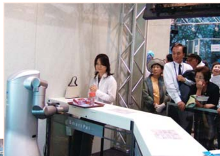
「プロトタイプロボット展」でお客様にサービスをしているSmartPal