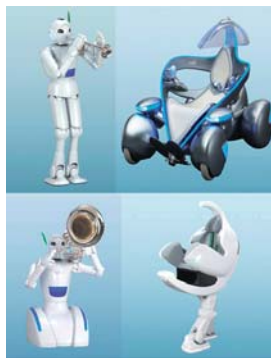
「トヨタグループ館」ロボットたち

東海旅客鉄道株式会社殿の「JR東海超電導リニア館」では、リニアモーターカーの1/50スケールモデル(走行長約17m)が展示されています。その滑らかな走行パフォーマンスの裏には、当社が開発したリニアモーター及びアンプが活躍しています。このモデルは車両に永久磁石、ガイドウェイ(軌道)にコイルを配置しています。一般的なリニアモーターはコイル全体に電気を流していますが、この1/50スケールモデルでは、少ない電力で長い距離を動かすことができるよう、走行部分だけに電気を流すなど工夫を凝らしています。