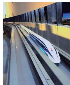
「JR東海超電導リニア館」リニアモーターカー

また、「プロトタイプロボット展*1」が去る6月9日から19日まで開催され、当社はSmartPalを展示しました。SmartPalは、人と共存して自律的に作業するために必要な腕部・移動部・コミュニケーション機能・環境認識機能・通信機能をもった、車輪移動形ロボットです。私たちの生活をサポートする「賢い友達になって欲しい」という思いを込めて、“SmartPal”と名付けました。展示会場では、60以上の企業や大学が開発したロボットが一堂に会し、広い会場内び2020年の未来の街を創り出しました。SmartPalは喫茶店のマスター役となり、お客様と会話しながら器用な腕で注文の品を取ってくるデモンストレーションを行いました。